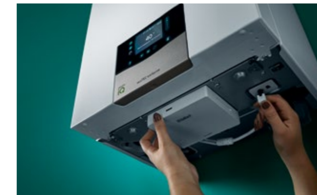
Instalirajte sistem sensoNET u tren oka

Crno: osnovni sistem sa uređajem ecoTEC exclusive, sensoCOMFORT VRT 720 i rezervoarom za toplu vodu Sivo: opciono dodaci - sobni korektori VR 92, modul za hidrauličko proširivanje VR 71, solarna priprema tople vode za domaćinstvo i komunikaciona jedinica sensoNET VR 921 za upravljanje aplikacijom i daljinsku dijagnostiku